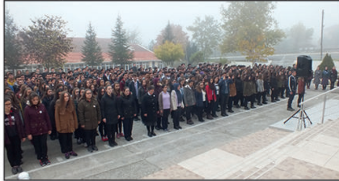
Ardından "Yıkın Heykellerimi" adlı şiiri seslendirmek üzere -bizlere şiirdeki duyguyu bire bir yansıtan-